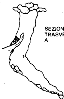
SEZIONE TRASVERSALE 1:50 A